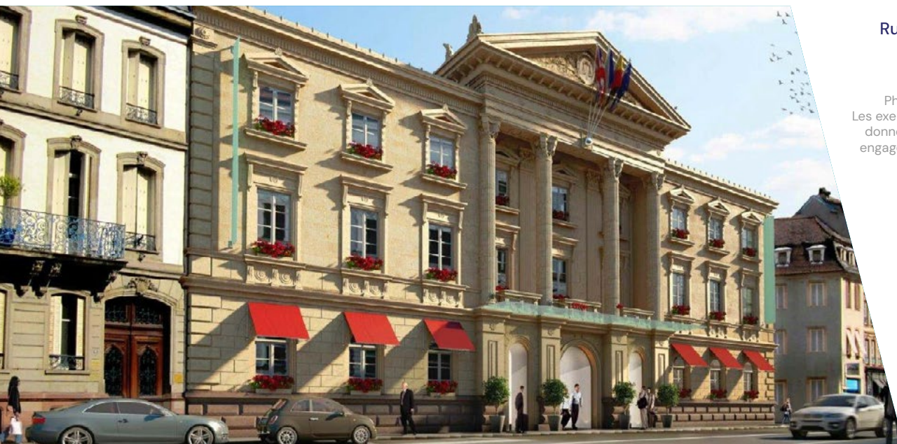
Rue de la Nuée Bleue Strasbourg (67) Hôtellerie | 6 665 m 2

Source des données de la SCPI - La Française: 31/12/2024. 1 La SCPI est détentrice de parts d'une société civile immobilière (SCI), propriétaire des ensembles immobiliers présentés. 2 Le taux d'occupation physique (TOP) se détermine par la division de la surface cumulée des locaux occupés par la surface cumulée des locaux détenus par la SCPI. 3 Le taux d'occupation financier (TOF) se détermine par la division du montant total des loyers et indemnités d'occupation facturés ainsi que des indemnités compensatrices de loyers par le montant total des loyers facturables dans l'hypothèse où l'intégralité du patrimoine de la SCPI serait louée.