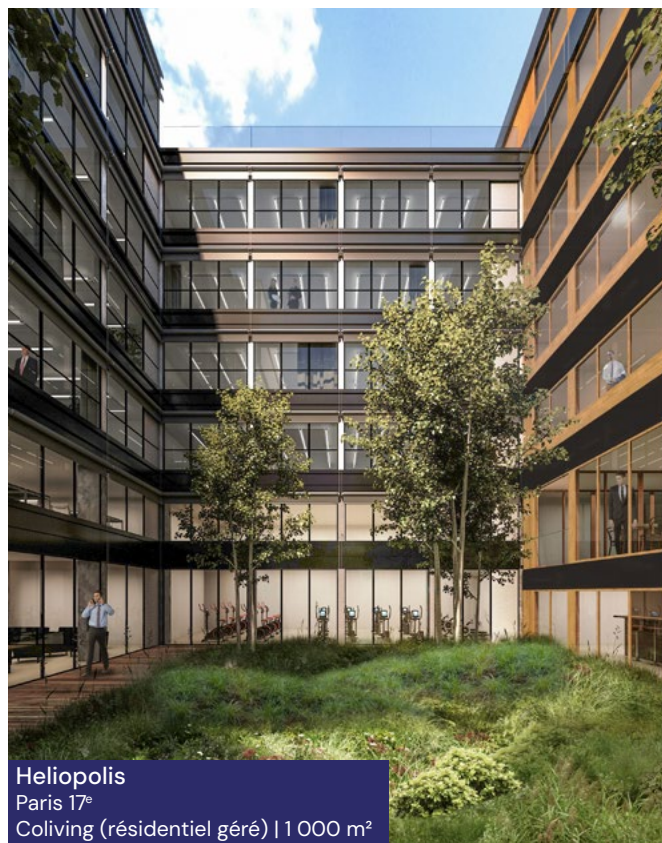
Heliopolis Paris 17 e Coliving (résidentiel géré) | 1 000 m 2