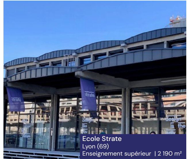
Ecole Strate Lyon (69) Enseignement supérieur | 2 190 m 2

Avec une plateforme européenne de professionnels de l'immobilier , permettant une sélection fine immeubles et des locataires, la SCPI vise à se constituer un patrimoine composé de bureaux, de commerces et de locaux d'activités ou d'entrepôts, mais également de typologies innovantes telles que la santé, l'hôtellerie ou encore le résidentiel géré (étudiant, senior, coliving) en France et dans des Etats qui ont été membres ou qui sont membres de l'Union Européenne.